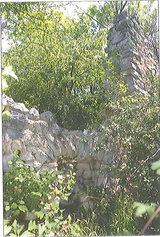
Ruines de Vières

La commune de Lardier et Valença, dont l'altitude se situe entre 550m et 1650m, résulte de la réunion de deux paroisses. Lardier, ( du latin aridus : endroit aride, Larderiae en 1099, première appellation Lardier en 1493 ) sur les plateaux et les montagnes qui dominent la Durance et Valença ( Valensanum en 1235 ) ancien domaine gallo-romain de Valentius ( Valens, Valentis ) sur les collines de la Durance.